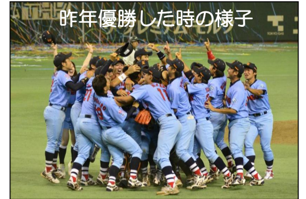
昨年優勝した時の様子

場 所:東京ドーム 試 合:7月12日(金)18時30分～ 相 手:NTT西日本(大阪市代表) ※JX-ENEOS野球部応援受付にてチケット配布します。