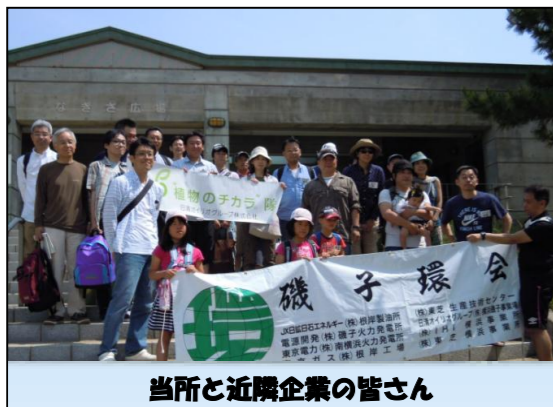
当所と近隣企業の皆さん

6月9日(日)海の公園において、近隣企業とともに「アマモ場再生活動(花枝採取会)」に参加しました。本活動は「金沢八景-東京湾アマモ場再生会議」主催により毎年開催されているもので、秋の種まき活動にも参加しております。