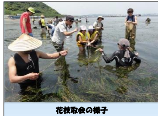
花枝採取会の様子