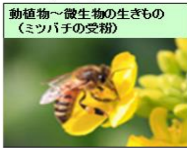
動植物～微生物の生きもの (ミツバチの受粉)