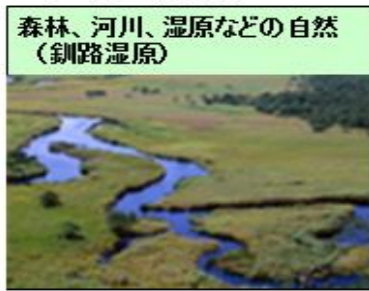
森林、河川、湿原などの自然 (釧路湿原)