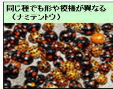
同じ種でも形や模様が異なる (ナミテントウ)

JXグループとしては、2010年愛知県で開催された生物多様性の国際会議（COP10）および生物多様性地域連帯促進法の制定に伴い、生物多様性保全への取り組みを開始しています。