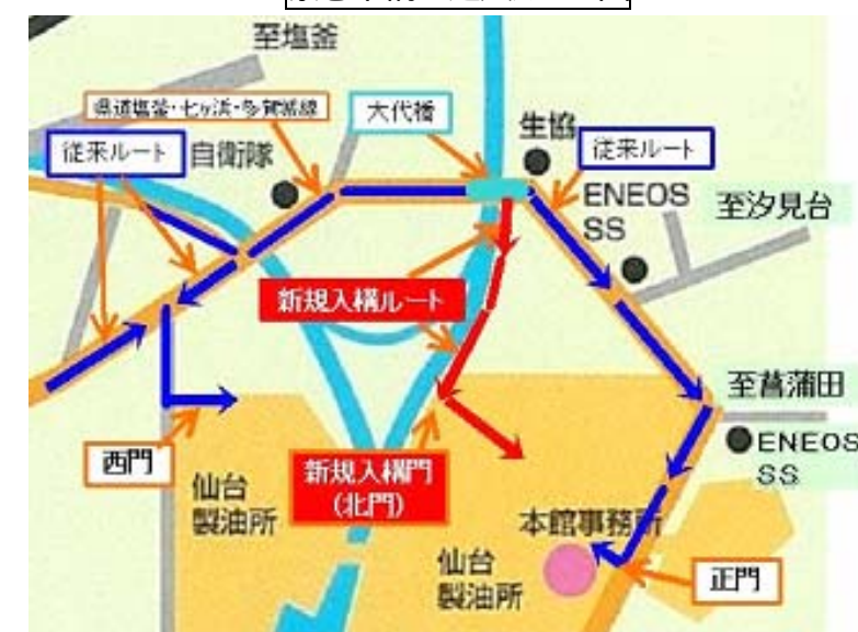
緊急車両の進入ルート図

これまでの進入路と合わせて、3本のルートで入構可能となることで、緊急時の迅速な対応に寄与できるものと思います。ご協力頂きました関係各位の皆様にご礼申し上げます。