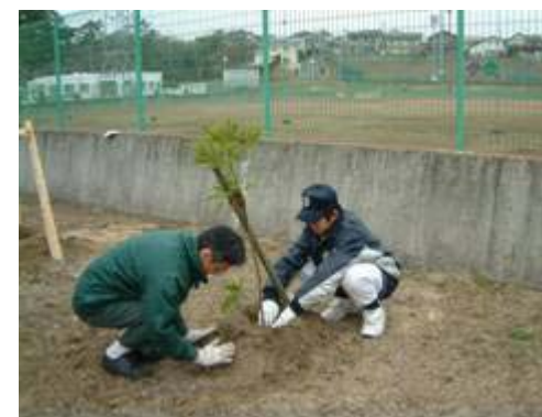
「大きく育てよ!!」と、たぶのきを植える 少年野球チームと当所員

七ヶ浜町緑化推進委員会 主催の『植樹祭』に、仙台製油所から6名が参加いたしました。この植樹祭は、七ヶ浜町が緑化推進の一環で実施されているもので、当所から50本の苗を提供し、七ヶ浜中学生硬式野球チームの選手27名の協力を頂いて、町のグラウンド周辺に植樹しました。