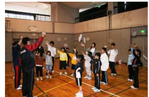
ラケット振りの基本練習風景

見学のお申し込み・本紙に関するお問合せは、仙台製油所地域交流室 フリーダイヤル：0120-330-201