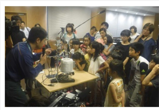
模擬原油を使用しての蒸留実験

国土交通省東北地方整備局 塩釜港湾・空港整備事務所主催による、小学生と保護者を対象にしたイベント「夏休み！仙台港みなと探検隊」が開催され、今回初めて、当所で見学を開催しました。