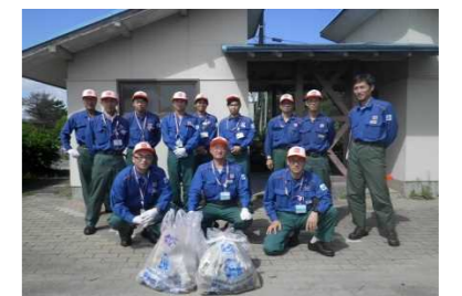
湊浜緑地公園の参加者