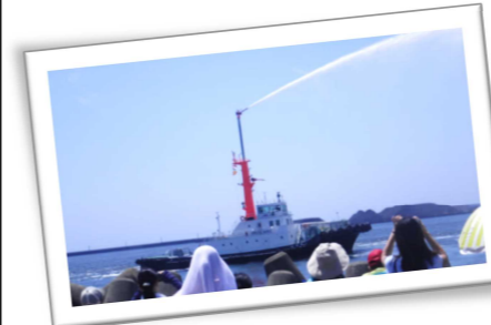
タグボートによる放水デモ

小学校高学年児童と保護者の皆様80名をお迎えして、河北新報社主催・当社共催による、「なつやすみ科学バスツアー」を今年も開催しました。