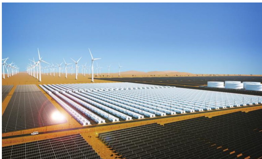
写真：風力発電 21km x 21km、太陽光発電 7km x 7km、Direct-MCH ™ 電解 700m x 400m、トルエン/MCH タンク 300m x 400m

当社は、カーボンニュートラル社会の実現に貢献する本技術開発を推進し、次世代エネルギー事業に取り組んでまいります。