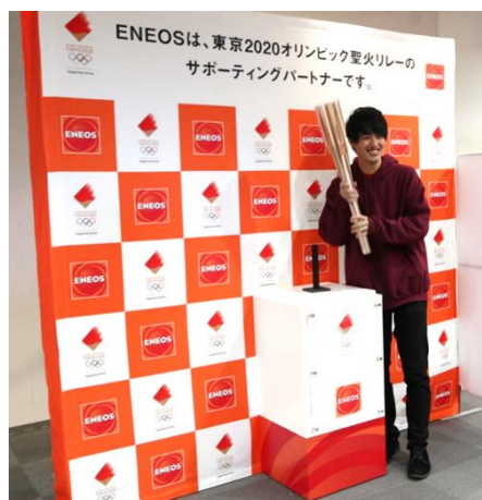
東京2020オリンピック聖火リレートーチ