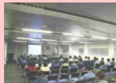
講習会の風景：講師の説明を真摯に聴講しました。

創刊号でご案内致しました、高圧ガス保安法の不祥事の再発防止活動を開始致しました。まずは、社外より講師を招き「企業倫理と法令遵守」と題した全所員対象の講習会を開催し、法令遵守の重要性を再徹底致しました。今後も、継続的に講習会を開催し、法令遵守の意識醸成に努めてまいります。