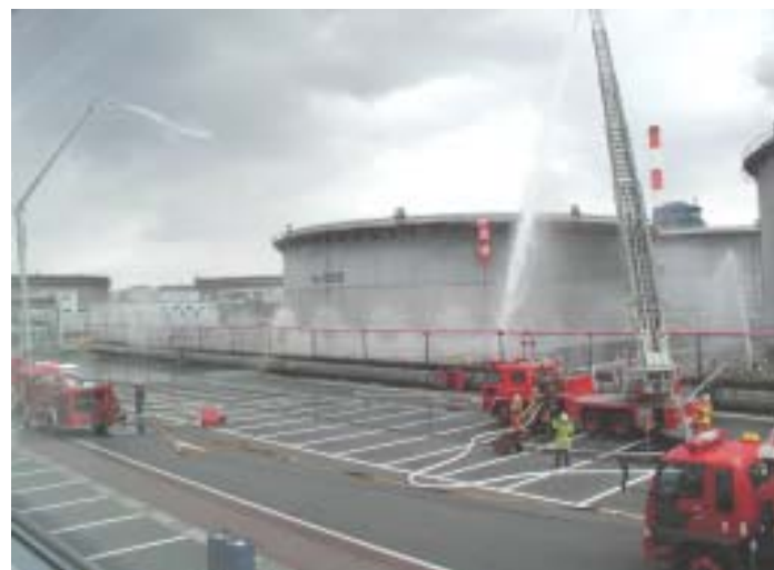
公設消防と連携し、本番さながらの消火訓練 (タンク火災を想定した高所放水車による訓練)

今回は当所の防災管理体制などについて、地域の皆様への理解を深めていただくための試みとして、和木町行政・議会の代表者、当所近隣の自治会長様などに実際の消火訓練を見学いただき、合わせて当所の有事に備えた防災管理体制などについても、ご説明をさせていただきました。