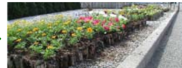
以前はこんな荒れ放題の状況だったのに...、一変してキレイで華やかになりました。