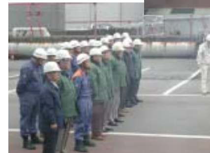
訓練見学の皆様も講評に参列いただき、訓練を肌で感じていただきました。(写真左)