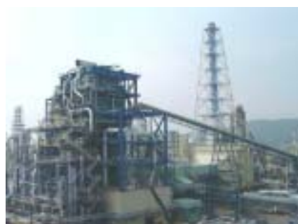
商業運転を開始する発電設備

昨年10月に完成し、試運転を行っていましたが発電設備が、半年間の各種試運転を経て4月1日より商業運転を開始いたします。ご支援・ご協力に熱くお礼申し上げます。