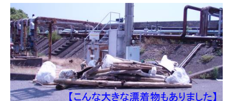
【こんな大きな漂着物もありました】

今後も所内の美化活動はもちろんのこと、岩国市等が主催する「海の日」協賛事業の岩国港清掃活動「きれいな港づくり」(今年度は雨天のため中止)などの社外で実施される清掃活動にも積極的に参加してまいります。