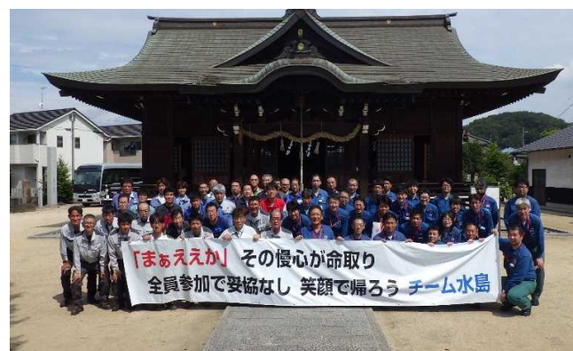
福田神社安全祈願