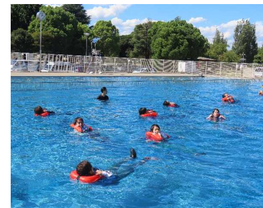
救命胴衣着用時の訓練

9月1日、防災の日に水島中央公園水泳場で着衣泳訓練を実施しました。社員・協力会社員計39名が参加し、水島海上保安部による指導の下、着衣泳では、動きが制限され、浮遊していても体力を消耗することを体感しました。救命胴衣の着用方法や栈橋からの転落時の対応方法など自分の身を守るだけでなく、ペットボトルなど身近な物を使った救助法など、周囲の人を助けるための行動も習得しました。