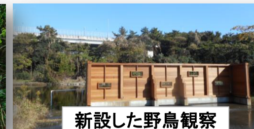
新設した野鳥観察