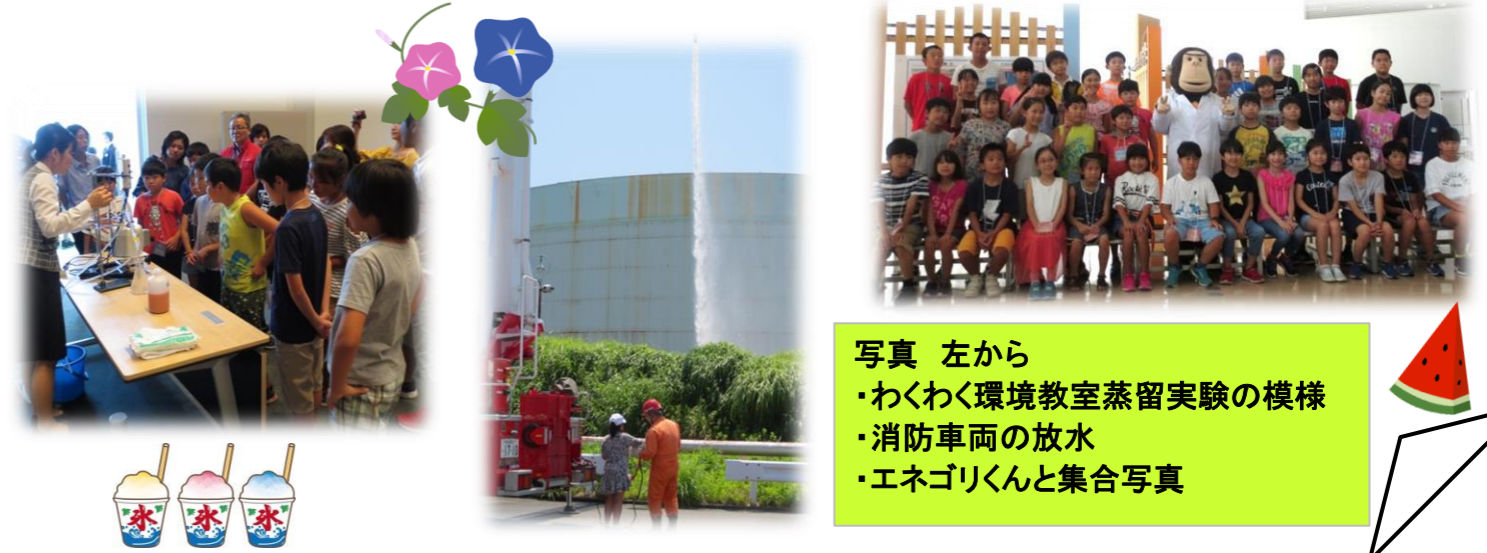
写真 左から ・わくわく環境教室蒸留実験の様相 ・消防車両の放水 ・エネゴリくと集合写真

8月1日(水)読売新聞社主催の「なつやすみ科学バスツアー」が開催されました。当所では構内見学やENEOSわくわく環境教室を実施いたしました。構内見学では製造装置や消防車両の放水をご覧いただき、わくわく環境教室では、当社の環境対策や蒸留実験を交え、石油製品の製造過程についてご説明をいたしました。