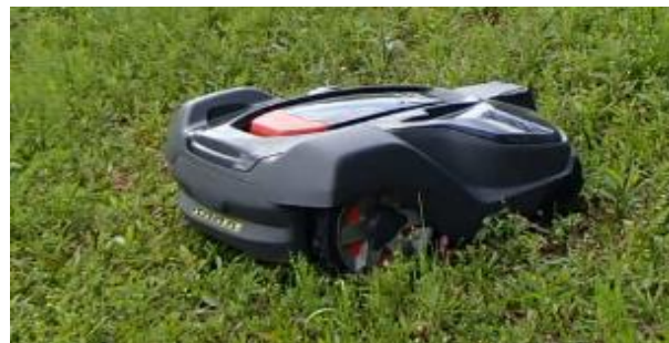
導入したロボット草刈り機

雨が降っても、猛暑日でも、文句を言わずに毎日草刈りを行うため、緑地管理に大変役立っています。