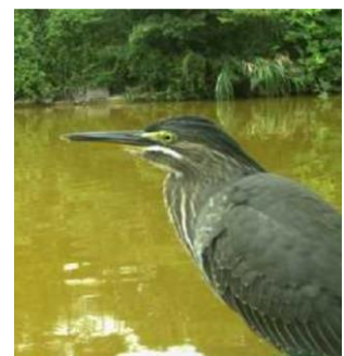
↑ 所内緑地帯で撮影された「ゴイサギ」の幼鳥

日本各地で見ることのできる鳥ですが、企業緑地で見られるのは珍しいことです。魚やカエル、甲殻類などを捕食する肉食性のため、ゴイサギにとって緑地帯が餌を得る好環境であることが証明されました。