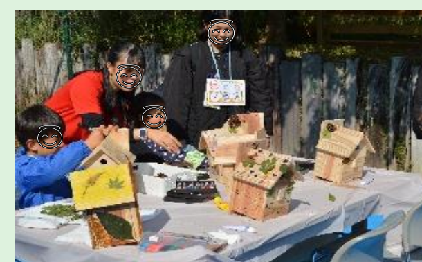
環境イベント（エネ森フェア）で巣箱の飾り付け

本紙に関するお問い合わせ先： 根岸製油所総務グループ TEL：045-757-7111