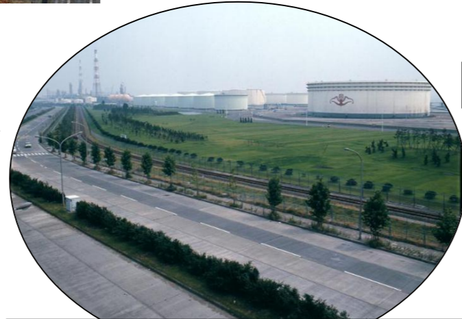
高速道路開通前の根岸製油所近く