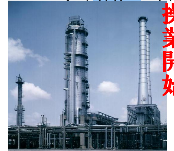
操業当時の常圧蒸留装置