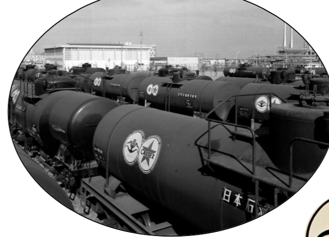
カルテックスと業務提携時のタンク車