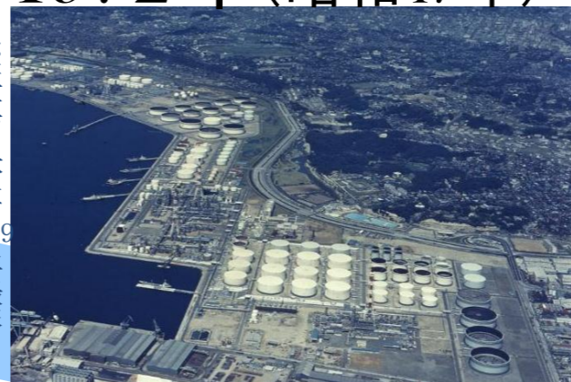
本牧2地区燃料油製造装置完成