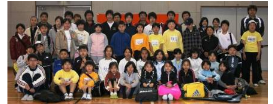
2009年度の生徒たちとコーチ記念撮影

2010年度についても、新入生を募集いたしますので、ご希望の方は以下の募集要項のとおりお申し込みください。