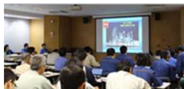
工事安全大会の様子

点検に先立ち、9月13日には工事安全大会を開催し、各協力会社に対し作業ルールや安全対策を説明・再確認するとともに、点検工事を無事故・無災害で完遂すべく、安全唱和を行い、工事関係者との連帯を図りました。