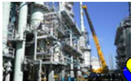
精製装置の点検修理

点検期間中は、念仏橋～湊浜周辺の交通渋滞を緩和するため、当所西門からの入構対策を実施しております。また、秋の全国交通安全運動期間に合わせ、近隣地区での交通立哨も実施しており、安全運転遵守につきましても徹底して参ります。