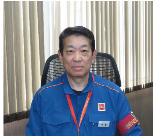
手島水島製油所長