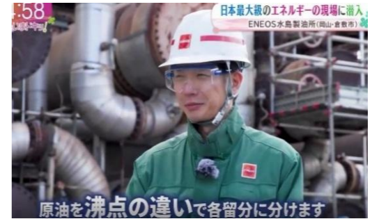
原油を沸点の違いで各留分に分けます 常圧蒸留装置を説明するシーン

当所野球班が、5月2日(土)、3日(日)に香川県で開催された「第46回瀬戸内都市対抗軟式野球大会」に、岡山県代表として出場いたしました。4試合を勝ち抜き、日本鉱業時代の第11回大会以来、35年ぶり3回目の優勝を果たしました。国民スポーツ大会・天皇賜杯における岡山県代表獲得ならびに全国大会出場を目標に、引き続き努力してまいります。