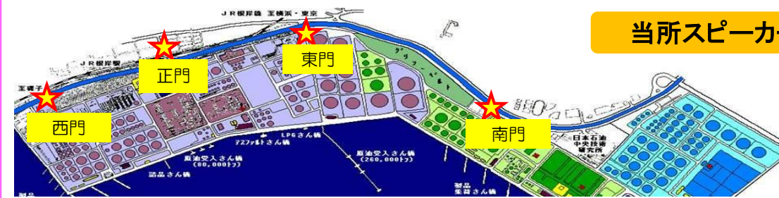
当所スピーカー設置位置

実施予定日:5月15日(金) 14:00より 荒天時は5月18日(月)同時刻に順延します。