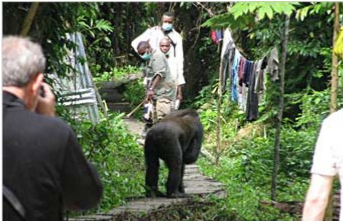
（写真1）橋の上のトラッカー、観光客と人付けされたゴリラ©WCS コンゴ共和国

クリック募金による寄付は、2012年12月から2013年1月までの期間では、引き続き、ゴリラの保全、調査、エコツーリズムを実施しているコンゴ共和国・モンディカの森での活動費（人件費、食糧費、維持費等）の一部に活用させていただきました。特に今回は、モンディカ・キャンプ脇を流れる川を渡るための簡易橋の補修工事費用（木材を切るための小型チェーンソー購入費も含む）にも使用いたしました（写真1）。