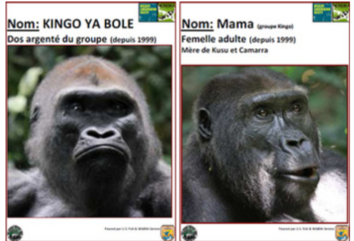
(写真2)ゴリラの個体識別票の一例©WCSコンゴ共和国(ともにキング・グループの個体:左はシルバーバックの“キング”、右は5頭いるうちの1頭のオトナ・メスの“ママ”)©WCSコンゴ共和国

このようにクリック募金は、野生のニシローランドゴリラの保全・研究活動に大きく貢献し続けていきます。今後とも、ご支援をよろしくお願いいたします。