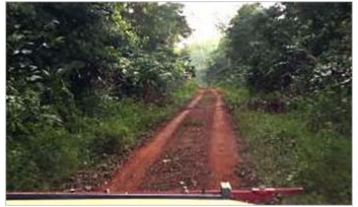
(写真1)モンディカまでのアクセスとなる未舗装道路(左側が草本類で前方がふさがっている状態、右側が山刀で開かれた同じ道) 写真下部の白い部分は車のボンネット

コンゴ共和国北東部全体は、モンディカ地域だけでなく、健全な頭数のゴリラが生息していることが我々によるこれまでの調査でわかっています。2006年までの動物の頭数・分布調査、モンディカを含むサンガ川の東(ヌアバレ・ンドキ国立公園とその周辺域:図2の赤い点線で囲まれた部分)約28,700km 2 の地域では、約46,000頭のゴリラの生息が推定されました(Stokes et al., 2010)。またその後2011年に実施されたほぼ同地域での動物の頭数・分布調査からは、この地域のゴリラの頭数に有意な変化がなかったことがわかりました。これは、我々による20数年に及ぶ保全活動の賜物といっても過言ではありません。