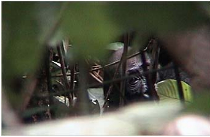
(写真2) サンガ川西地域「緑の魔境」で観察された野生のニシローランドゴリラ

ただ、西地域では2008年以降動物の頭数・分布調査行われていないため、この2014年1月から、西原のコーディネートによるWCSチームによって調査が開始されます。この地域の一部では、一時的にエボラの蔓延があった上、熱帯林伐採区の拡大により密猟も増加している中、どの程度ゴリラの頭数が変動したか、結果を知ることは、今後の保全戦略を立てる上で肝要です。調査は今年の7月くらいまでには終了し、分析結果は、早ければ2014年末には示されるでしょう。今回の報告書の期間、この動物センサス・プロジェクトの準備(担当者のコンゴ国内出張など)を開始し、クリック募金の一部をその費用に活用させていただきました。