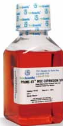
図2 PRIME-XV™ MSC Expansion SFM