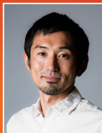
トークゲスト 為末 大さん

スプリント種目の世界大会で 日本人として初のメダル獲得者。 男子400メートルハードルの 日本記録保持者(2018年8月現在) 現在は、Sports×Technologyに 関するプロジェクトを行う株式会社 Departare Partners の代表を 務める。