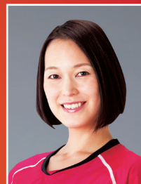
トークゲスト 大山 加奈さん

高校在学中に全日本に初選出 され、アテネ2004オリンピック、 世界選手権、ワールドカップと三大 大会すべての試合に出場。 現役時代は「パワフルカナ」の 愛称で親しまれ日本を代表する バレーボールプレーヤーとして活躍 した。