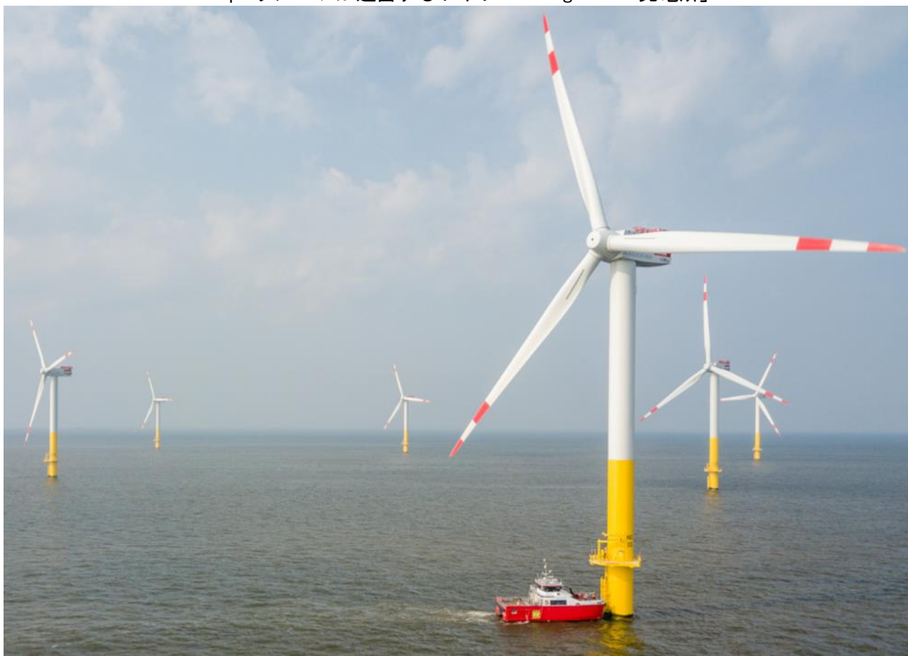
「wpd グループが運営するドイツ Nordergruende 発電所」