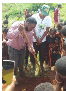
(マダガスカル植樹指導)