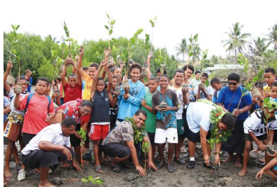
(フィジー 植樹風景)