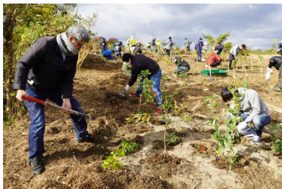
(大阪府堺市 植樹風景)