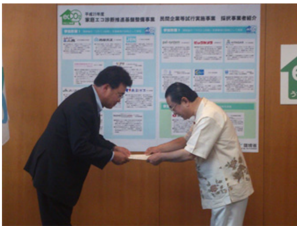
田中環境副大臣(右)からの協力依頼手交

なお、本日13時より環境省において「民間企業等試行事業者採択式(キックオフミーティング)」が開催され、当社も今回採択された事業者の一員として参加いたしました。