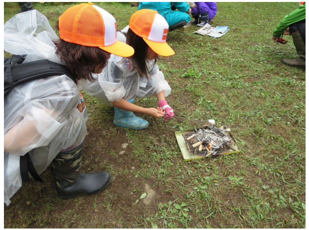
・焚き火起こし体験(2013年の模様)