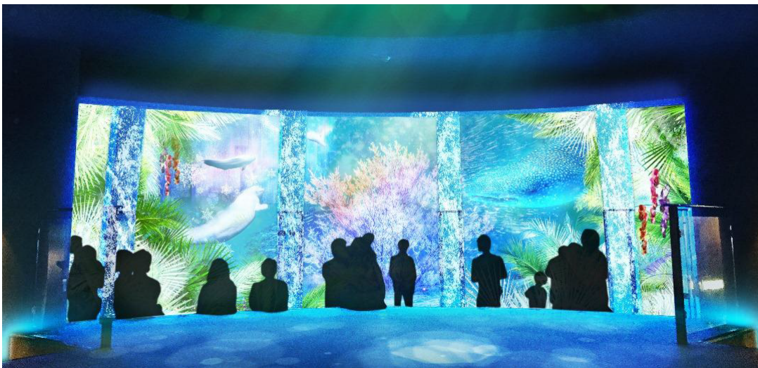
写真4: SNOW AQUA FOREST(天井から「ミライフ®」をオーロラ状に垂らし、スクリーンとして使用)