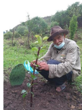
（植樹の様子：ポリビア）