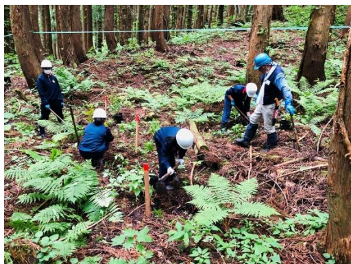
（植樹の様子：青森県鱒ヶ沢町）