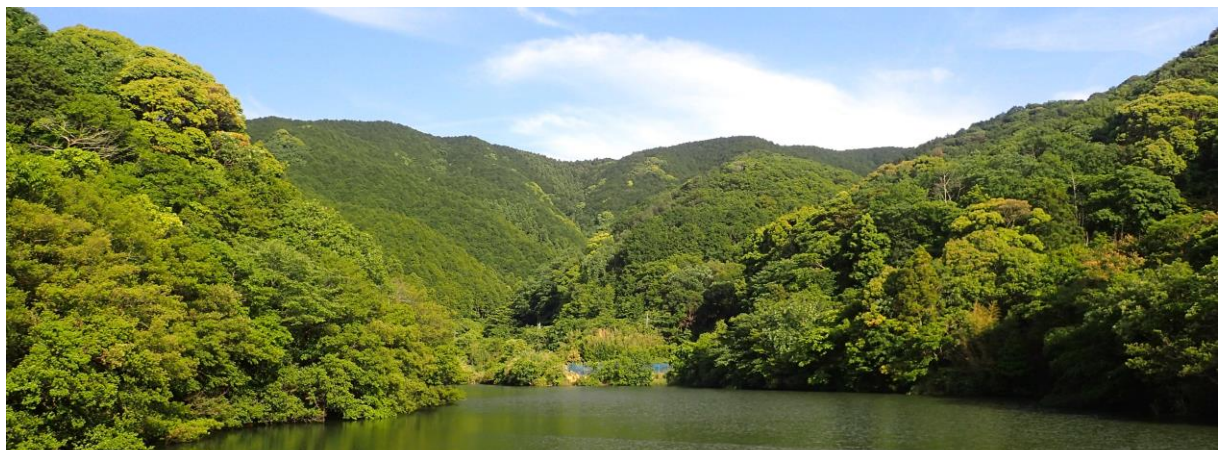
わかやま森林と緑の公社が管理する森林(日高郡由良町、中央のスギ・ヒノキ林)