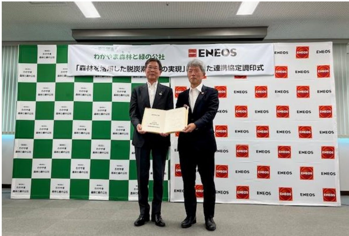
協定を締結するわかやま森林と緑の公社 下 理事長（左）、ENEOS 志賀 常務執行役員（右）