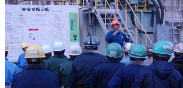
朝礼では、工事関係者ととも日々作業指示内容や注意喚起を行います。