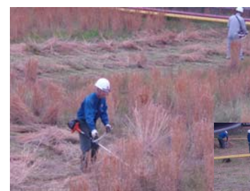
タンクヤード内の伸びた草を草刈機で刈ります。

「自分たちが働く製油所は、自分たちできれいに大事にしよう」という「マイ・リファイナリー意識」の向上のため、「刈っちゃう会」と称した所員による自主的な草刈活動を毎月1回実施しています。1回あたりの作業時間は30分程度ですが、製油所的美観維持のためにこれからも継続して取り組んでいきます。