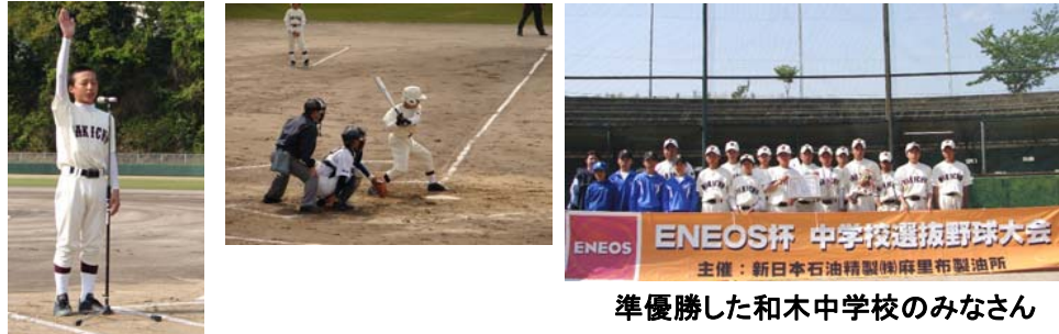
和木中学校主将による選手宣誓

5月2、3日の2日間、近郊より選抜された8つの中学校による「第30回ENEOS杯選抜中学校野球大会」を岩国市民球場にて開催しました。昨年優勝の和木中学校は決勝まで勝ち進み岩国中学校と対戦しました。序盤先制しましたが、1-3と逆転され、惜しくも優勝を逃しました。