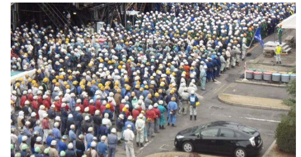
従業員・工事関係者一同に会し、無事故・無災害で工事を終了できるよう意思統一を図るべく、約1,900人の参加により安全大会が実施されました。