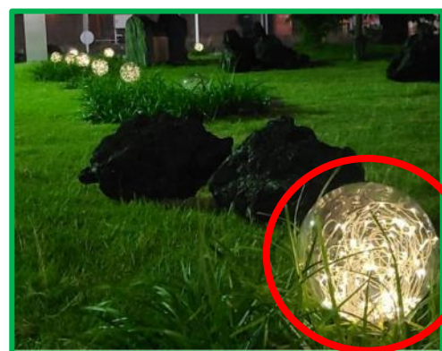
土壤発電で点灯するボタニカルライト↑

(※) 土壤発電は、植物の光合成で生成した糖(デンプン)を土壤中の細菌が食べて、分解した時に放出する電子を利用して発電する仕組みとなっています。植物が育つ土壌や水辺に電極を差ししておくだけで発電できる未来のエネルギーです。