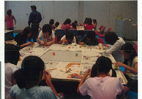
3色のろうそを使った“ろうそく作り”！