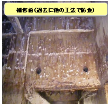
補修前(過去に他の工法で防食)