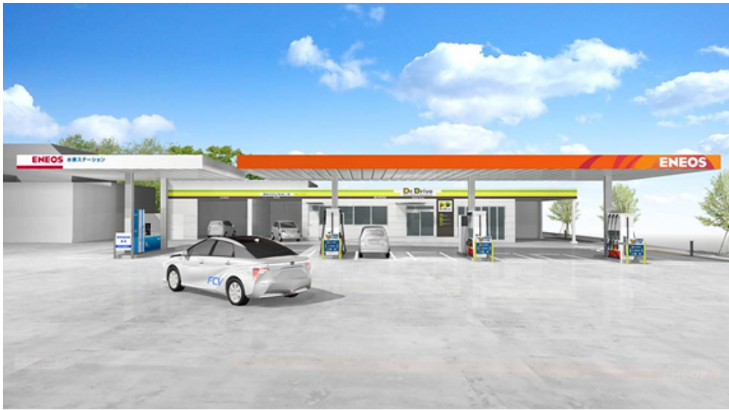
(2) 単独型ステーション