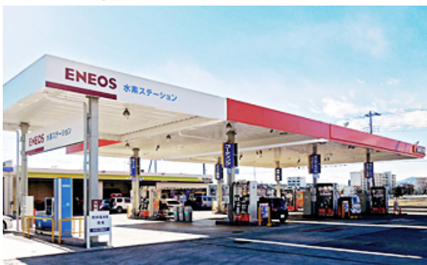
<Dr. Drive海老名中央店の外観>