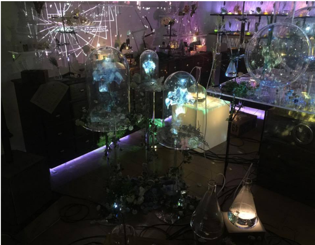
写真4:BIG FLOWERS (「ミライフ®」を使用)